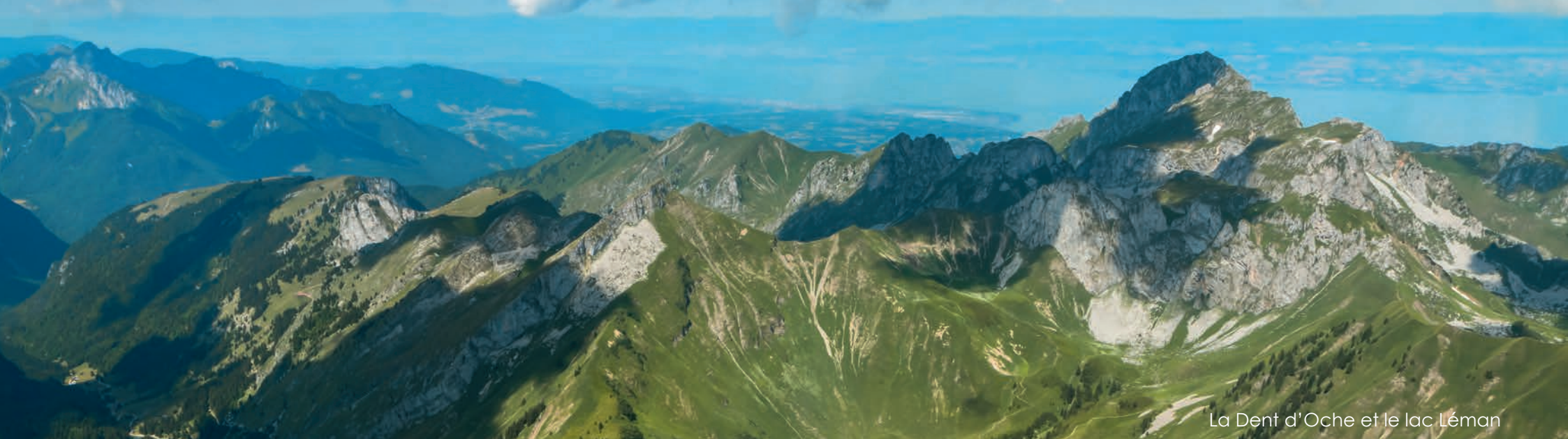
La Dent d'Oche et le lac Léman